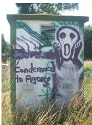
Graffiti librement inspiré du tableau de Munch (près de la voie de chemin de fer entre Sehnde et Lehrte)