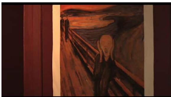
Edvard Munch : Le cri (1893), affiché à la porte de la chambre d'Hubert